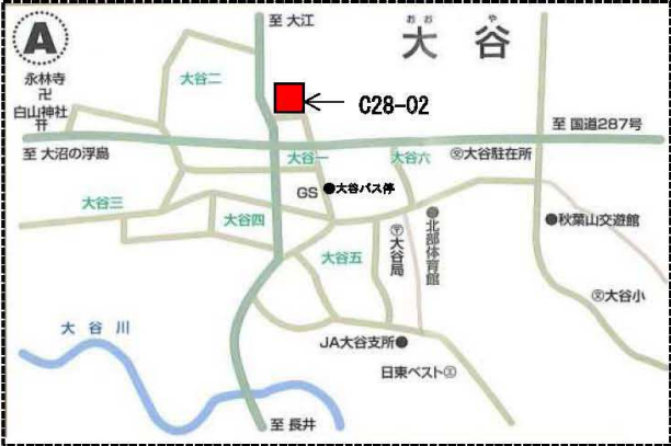
朝日町（大谷地区—宮宿地区）概略図