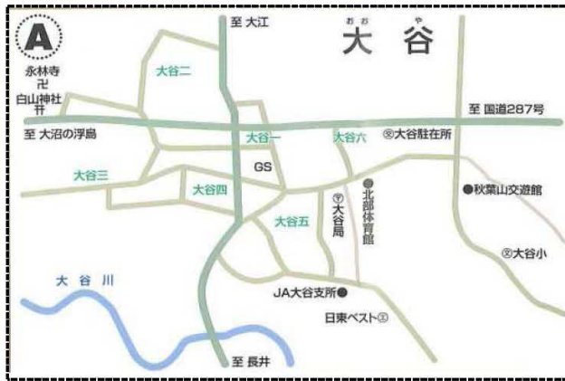
朝日町（大谷地区—宮宿地区）概略図