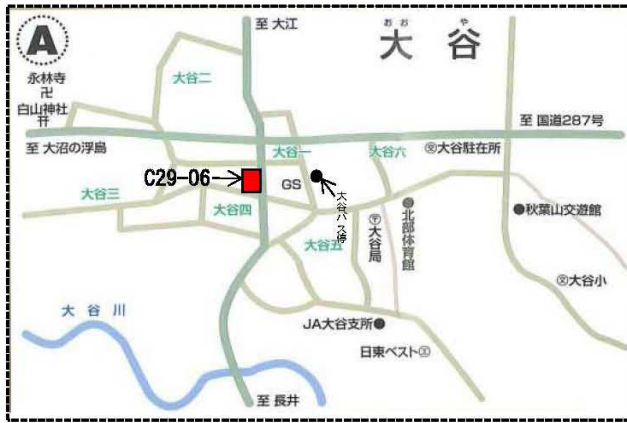
朝日町（大谷地区—宮宿地区）概略図