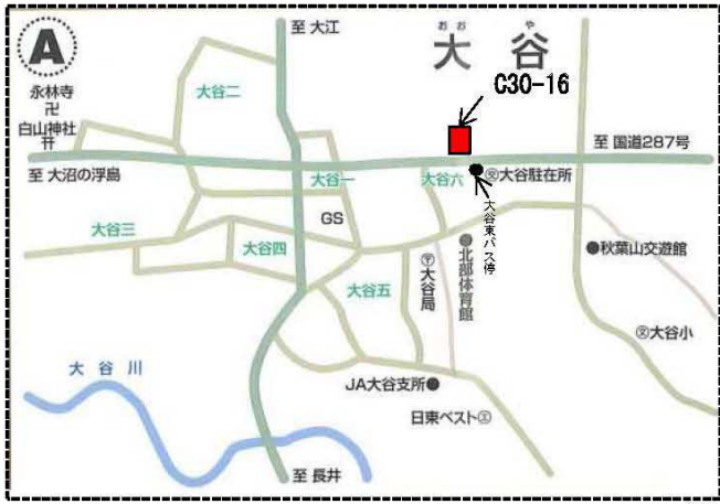
朝日町（大谷地区—宮宿地区）概略図