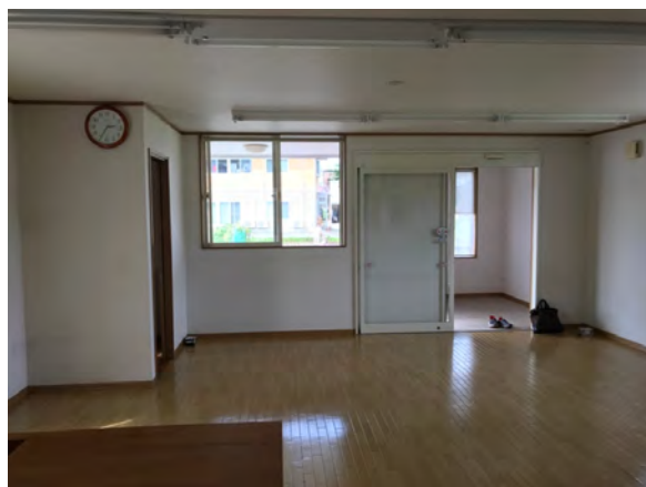
カウンター内から